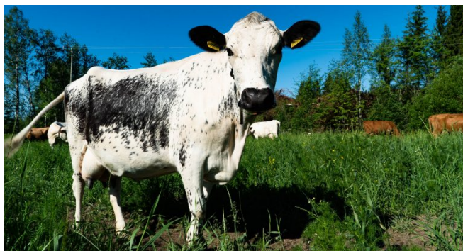
Bild Nordiska fjällkor- kulturarv och genetiska resurser

I projektet Nordiska fjällkor – kulturarv och genetiska resurser är målsättningen att kartlägga och spara information om fjällkorasernas historia, kulturella traditioner och genresurser. Hittills har totalt 9 561 personer deltagit i insatser som framhåller regionens kulturarv, vilket ska jämföras med programmets slutmål som är 9 000 personer. Även den andra indikatorn, som mäter deltagande i utvecklingsfrämjande insatser för samisk kultur och samiska förhållanden, har ökat under året. För närvarande har hittills 8 258 personer deltagit i sådana aktiviteter. Den indikatorn har därmed inte heller så långt kvar till slutmålet som är 8 500 personer.