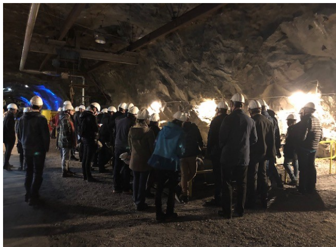
Bild Arctic Labour: Studerande och personal från OSAO och Utbildning Nord besöker LKAB-gruvan

Några andra exempel på projekt som pågår inom insatsområdet sedan tidigare är bland annat Biegganjúnázt som har huvudmål att erbjuda gränsöverskridande undervisning inom renskötsel, och projektet Academic North , som ska hjälpa akademiker hitta arbete på ett socialt hållbart sätt och att bidra till lösningar kring bristen på kompetent arbetskraft inom framför allt ICT-branschen.